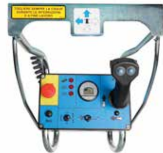
Quadro comandi sulla piattaforma semplice e intuitivo